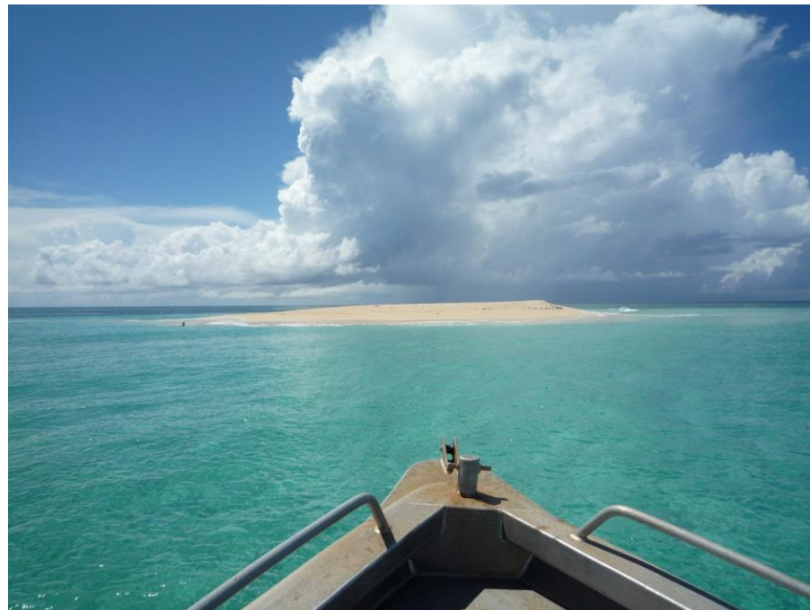
Ilot de Sable Blanc