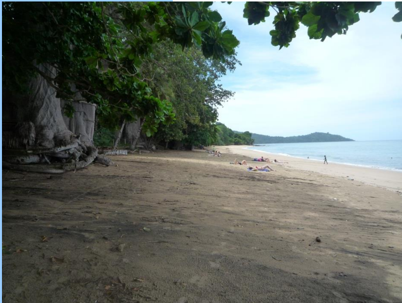
Plage de N'GOUJA