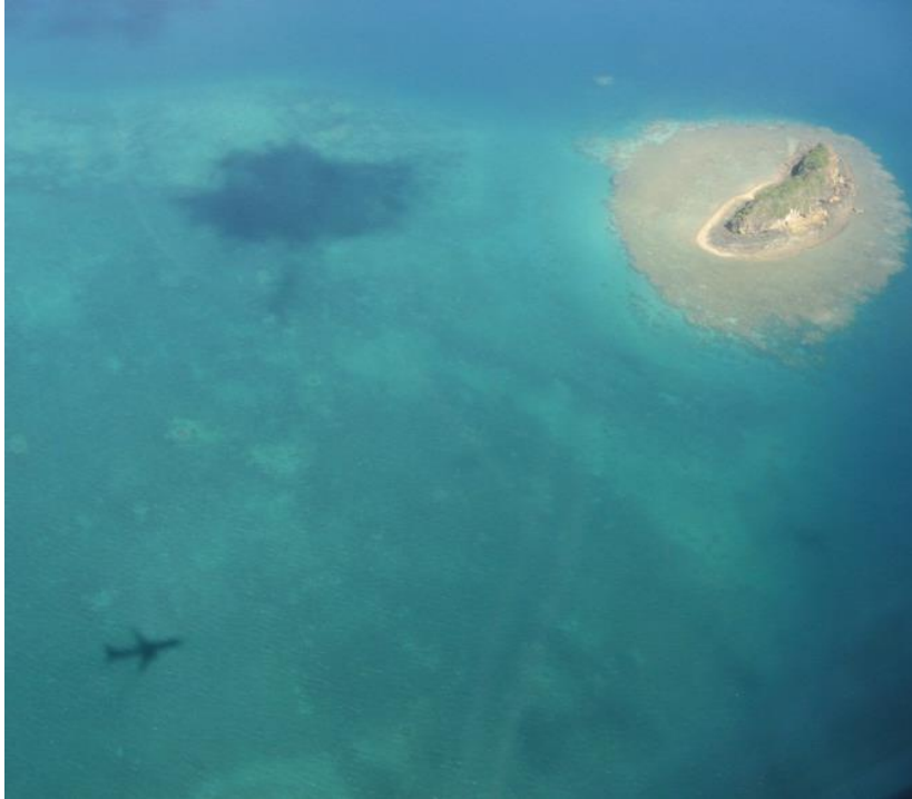
L'arrivée sur Petite-Terre