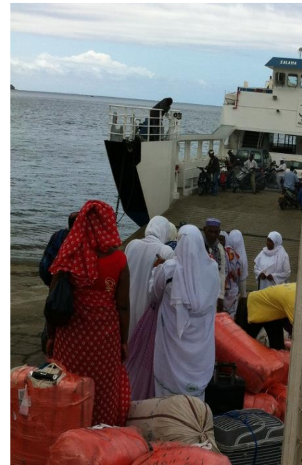
La Barge à Petite-Terre